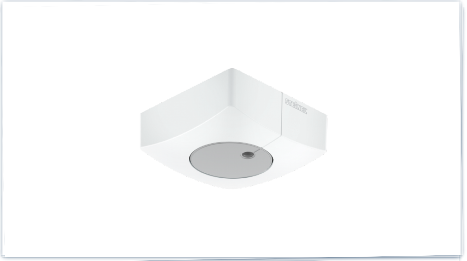
LIGHTSENSOR DUAL LEVELINK