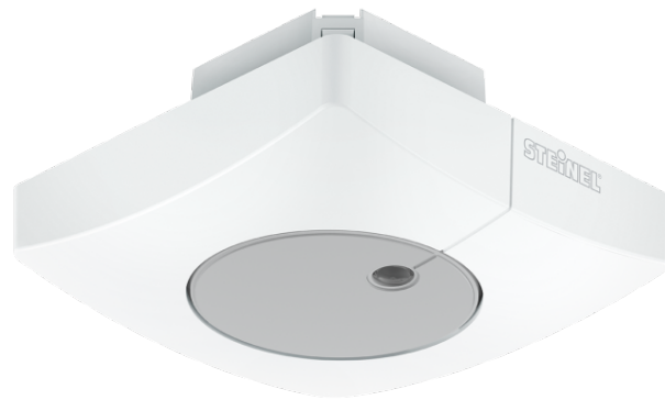
LIGHTSENSOR DUAL KNX UP KVADRAT