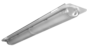
MAX KIT-600 LED