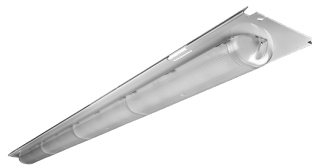
MAX KIT-1200 LED