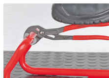
Forskjøvete tenner mot dreieretningen gir en selvklemmende effekt og forhindrer rutsjing på arbeidsstykket