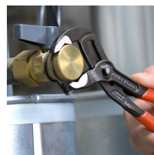
Hurtig og nøyaktig innstilling direkte på arbeidsstykket