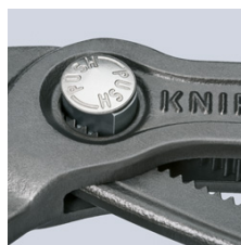
Finjustering med trykknapp: hurtig og komfortabel