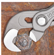
Arbeid på rustne muttere med runde kanter