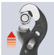
Finjustering med trykknapp: hurtig og komfortabel