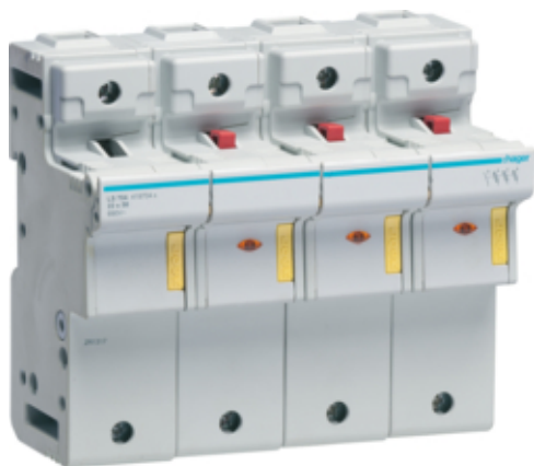
CC 3P+N 125A L58 acc.8m