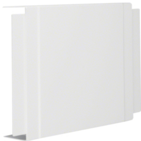
T-STYKKE FOR LF/FB60230 PH