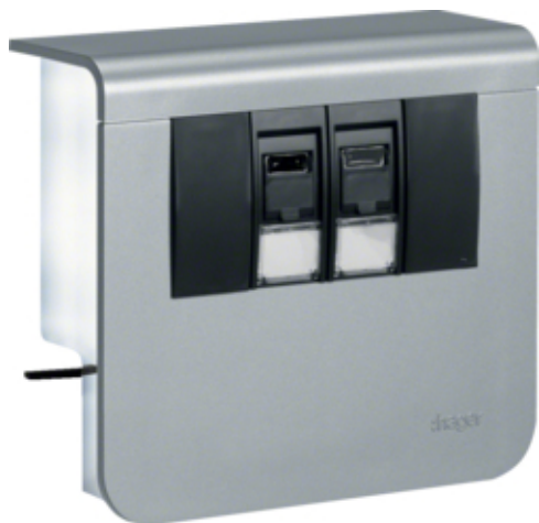
2xKAT.6 FOR SL 55mm ALU