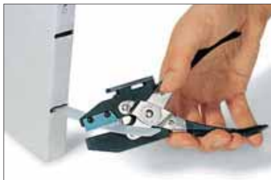
Lengder etter behov....

HCT1 og HCT2 verktøy er ideelle for kutting og hullstansing av merkeprofil HCR. Stanseverktøyet er utviklet for HCR09 (HCT1) og 12 (HCT2) skiltprofiler. For Helafix HCR06, 18 og 24 skiltprofiler kan individuelle hull stanses ut med begge verktøyene. Begge verktøyene stanser ut hull med en diameter på 2,5 mm. For å feste merkingen (HC og HCR) benytt nitte eller T18 buntbånd.