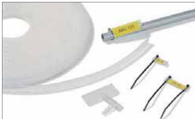
Helafix HC og HCR skiltprofil; multifunksjonell merking.