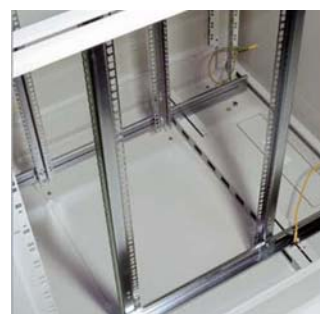
Fleksiramme for kombinert 19"/21" og sideforskyvning