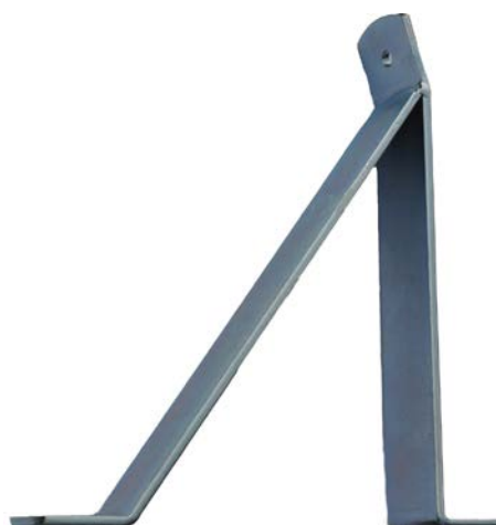
E6300008 CQ Vinkelfästa

CQ Vägffäste för svängdörr. 230mm hög, 180mm bred. Fastsättning i vägg 2st M10. Vinkelfäste som används med CQ Safe M8 alt.CQ Komplet. OBS använd den M8 skruv som medföljer magnetleverans för att inte påverka centrumtapp. Gängning i magnet max.8mm.