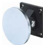
E6306194 (Flexibelt ankare ingår)