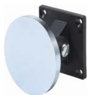
Flexibelt ankare ingår i CQ Standard

E6306192 kan även monteras på väggfästen E6306197 samt E6306198