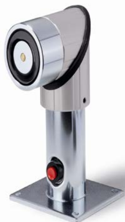
E6306136 i vridet tillstånd, golv eller tak montage (150mm)

Tube kan förkortas av kund till 110mm resp.145mm vilket innebär att de flesta längder mellan dörr och vägg är möjligt. För CQ Safe medföljer inte ankare.