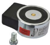
E6300009 CQ M8