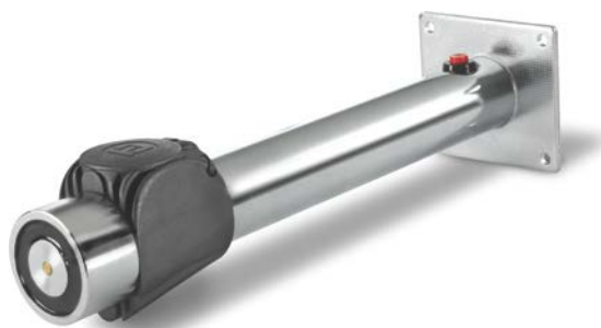
E6306142 i rakt tillstånd, väggmontage (475mm)

För CQ Standard medföljer flexibelt ankare E6306139.