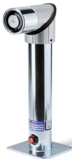
E6306138 i vridet tillstånd, golv eller tak montage (450mm)