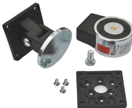
E6300011 CQ Komplet