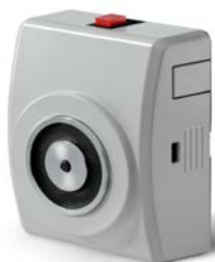
E6306195 (Ankare ingår)

Teleskopankare E6306193 med 20mm återfjädrande dämpning är lämpligt för skjutdörrar.