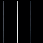
Svetstråd 074210 - ABS 073411 - PP 071219 - HDPE 073114 - PVC