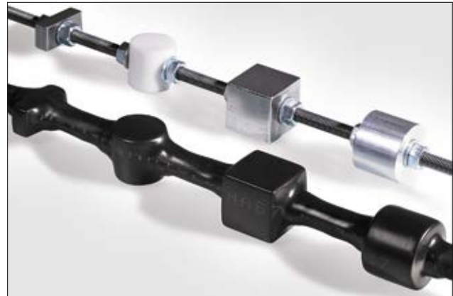
Pga. det høye krympeforholdet er HA67 velegnet for varierende former og størrelser.