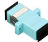
SC MM SPX OM3