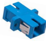
SC SM SPX