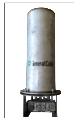
Skjøt El. nummer 69 51 015